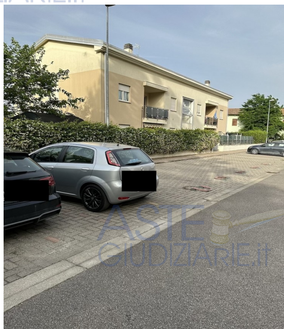
Foto n.6 - Panoramica stalli