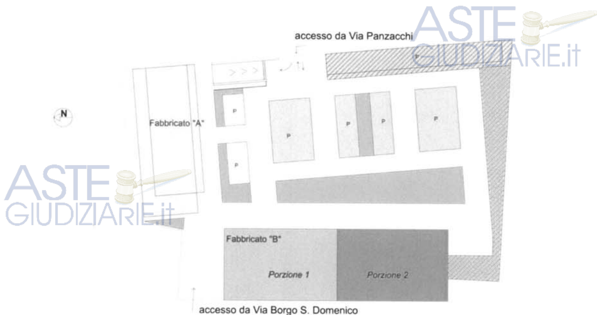
Planimetria generale del lotto - scala 1:500